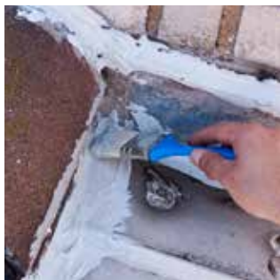
2. Rozetření štětcem. Lze aplikovat i několik vrstev.