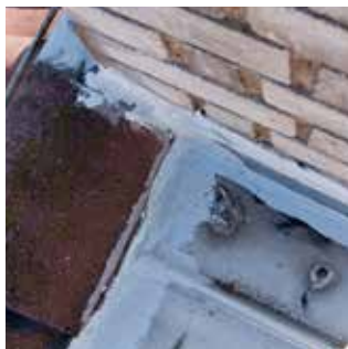
4. Membrána vytváří funkční a přitom čistý estetický detail.