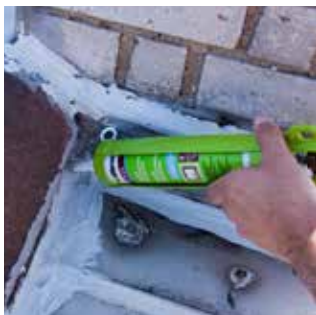
1. Aplikace membrány z kartuše.