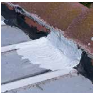
3. Po vytvrzení je membrána elastická a velmi pevná.